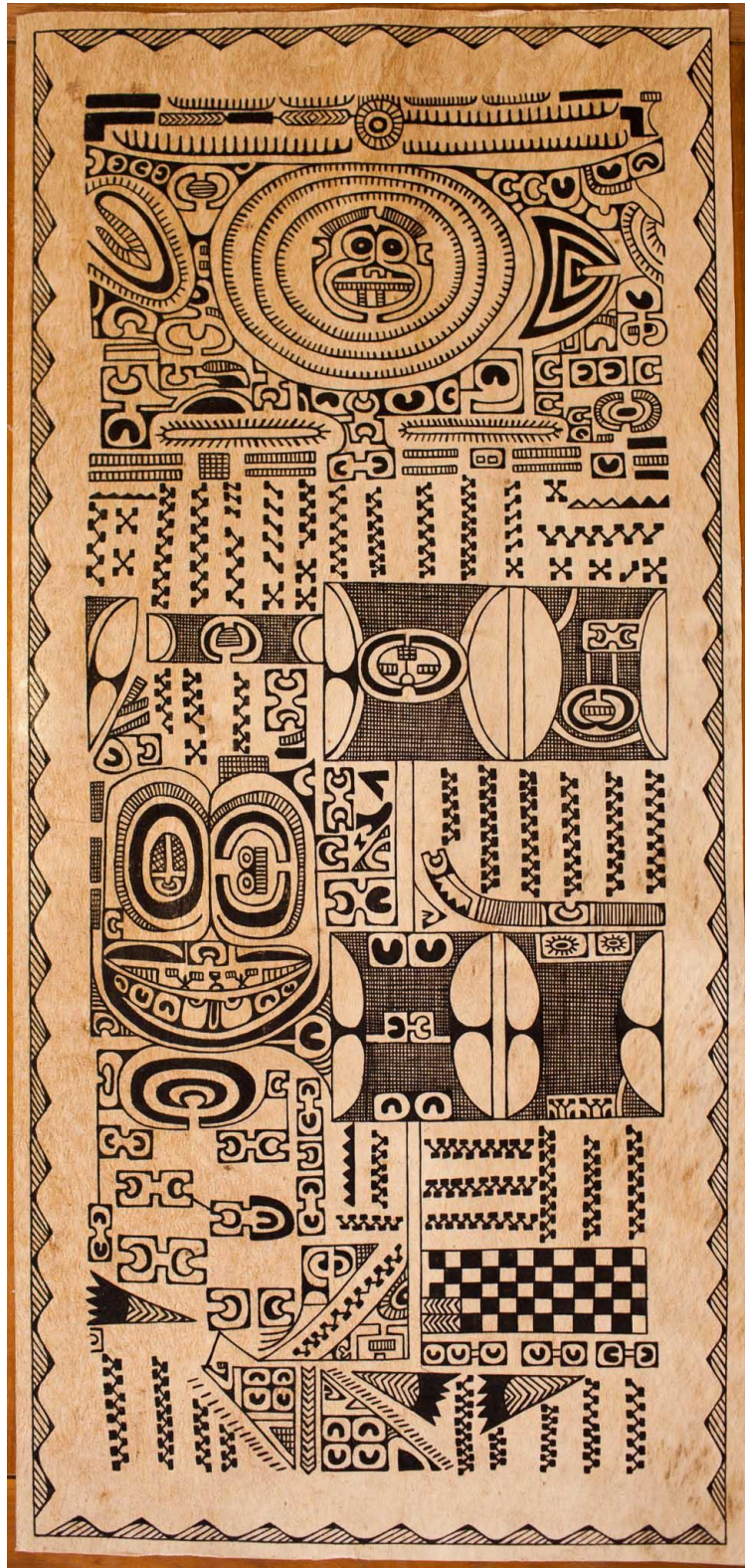
Matatiki sur tapa