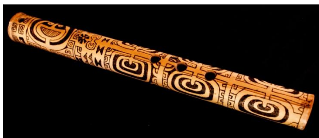
Pyrogravure sur bambou